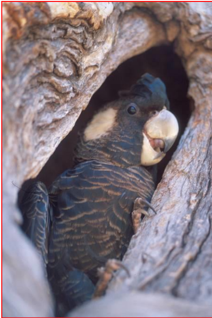
在巢穴中的雌性鳳頭鸚鵡